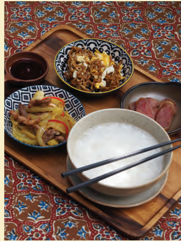
Boiled rice set Served with 3 side dishes ชุดข้าวต้มก๊วยพร้อม กับ 3 อย่าง 120-