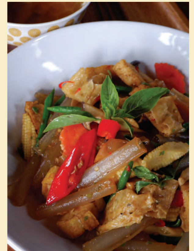
Stirred-fried spicy basil Shanghai noodle ผัดเส้นเซี่ยงไฮ้ชี้มาเต้าหู้ (มังสวิรัต) 120-