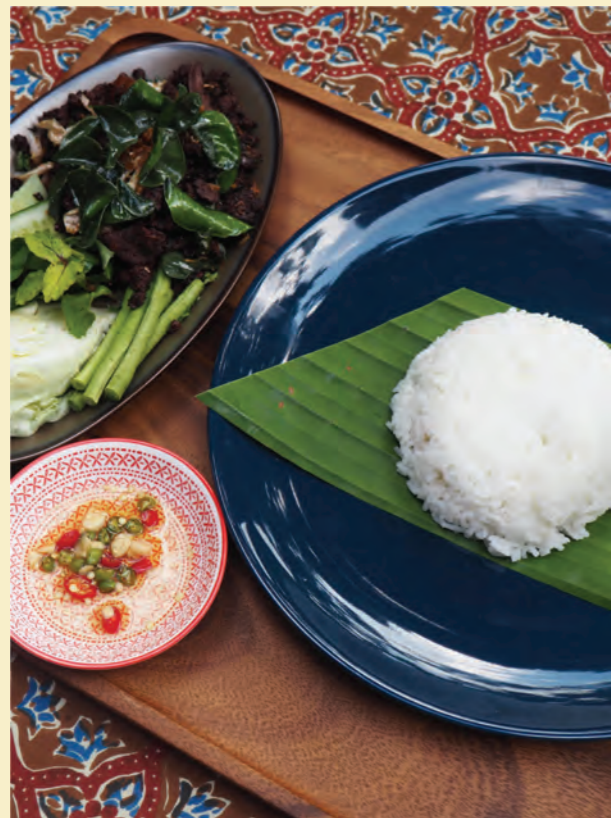
Roasted northern style pork larb rice set ชุดข้าวลาบหมูคั่ว 120-