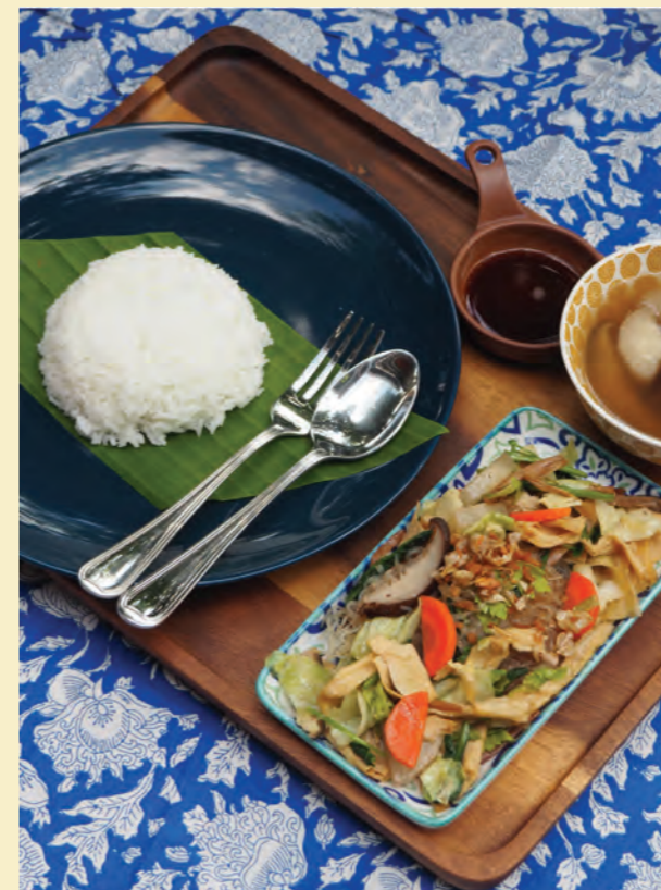
Rice with stirred-fried Chinese vegetable stew set ชุดข้าวจับถั่วแห้ง (มังสวิรัต) 120-