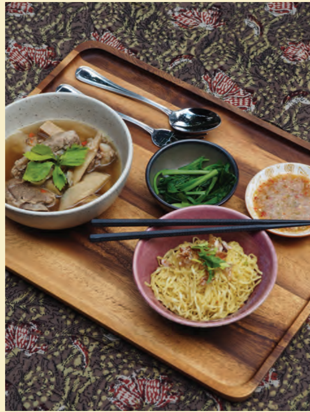
Grandma's braised pork or meat soup set ชุดซุปรกหมูตุ๋น หรือ เนื้อตุ๋น สูตรคุณยาย 130-