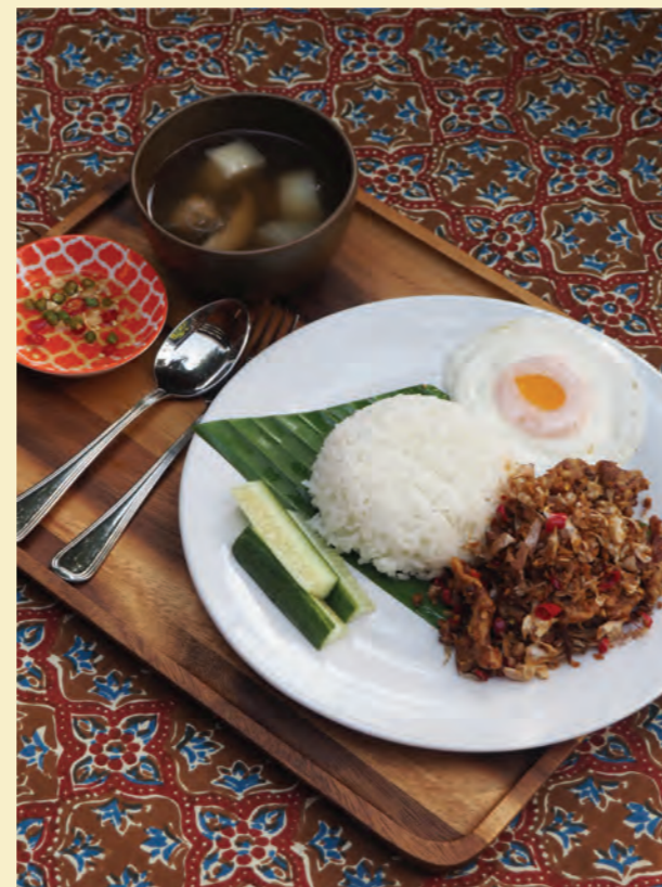
Rice with chillis and salted pork or chicken set ชุดข้าวหมู หรือ ไก่ผัดพริกเกลือ 120-