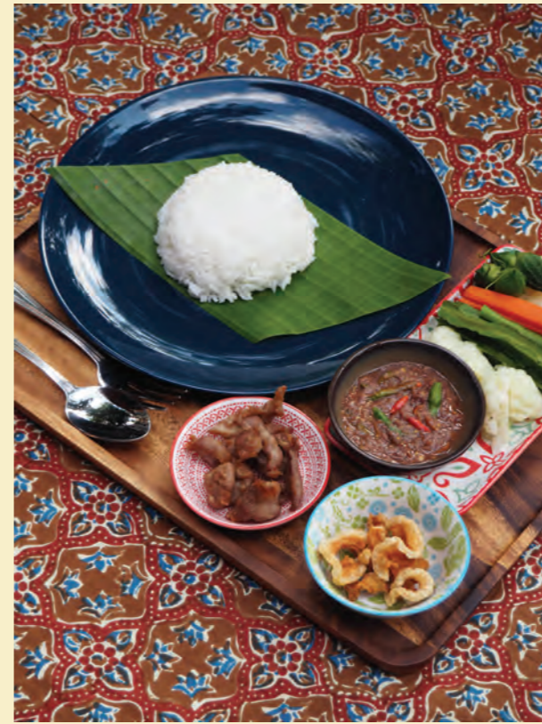
Grandma's chilli paste set ชุดข้าวน้ำพริกคุณยาย 130-